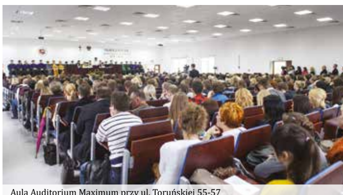
Aula Auditorium Maximum przy ul. Toruńskiej 55-57