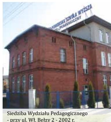
Siedziba Wydziału Pedagogicznego - przy ul. Wł. Bełzy 2 - 2002 r.

W odpowiedzi na zapotrzebowanie na rynku pracy w 2019 r. uruchomiony został kierunek Pielęgniarstwo (studia I stopnia licencjackie i studia II stopnia magisterskie). W 2023 r. uruchomiono kierunek Psychokryminalistyka studia I stopnia licencjackie i studia II stopnia magisterskie. Wznowiono również jednolite 5-letnie studia magisterskie nauczycielskie na kierunku Pedagogika przedszkolna i wczesnoszkolna.