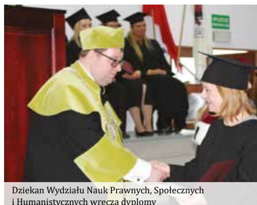
Dziekan Wydziału Nauk Prawnych, Społecznych i Humanistycznych wręcza dyplomy

Studia skierowane do osób pragnących doskonalić swoje umiejętności tłumaczeniowe w zakresie przekładu szeroko pojętych tekstów kultury. Program studiów łączy naukę zaawansowanych struktur, słownictwa, frazeologii i stylistyki języka angielskiego z przyswajaniem wiedzy z dziedziny przekładoznawstwa oraz współczesnych teorii kultury. W toku studiów studenci zgłębiają społeczne, literackie, historyczne i artystyczne aspekty kontekstów kulturowych krajów angielskiego obszaru językowego by następnie wykorzystać zdobytą wiedzę podczas zajęć praktycznych, które przygotowują do przyszłej pracy zawodowej. Warsztaty tłumaczeniowe prowadzone przez pełen cykl studiów umożliwiają studentom doświadczenie przekładu szerokiej gamy artefaktów kulturowych, począwszy od tekstów literackich poprzez naukowe, publicystyczne i prasowe a skończywszy na tłumaczeniu dialogów filmowych, gier komputerowych i innych form rozrywki interaktywnej. Nie może również zabraknąć elementów nowych technologii – studenci uczą się wykorzystywania komputerowych narzędzi wspomagających pracę tłumacza, w tym opartych na algorytmach sztucznej inteligencji. Dwuletnie studia umożliwiają zdobycie tytułu magistra oraz atrakcyjnych na rynku pracy kompetencji i kwalifikacji w zawodowej roli tłumacza-specjalisty.