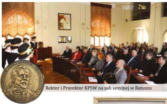
Rektor i Prorektor KPSW na sali sesyjnej w Ratuszu

Od 2012 roku Uczelnia otrzymuje certyfikat „Dobra Uczelnia - Dobra Praca”, przyznawany przez Akademickie Centrum Informacyjne w Poznaniu, które realizuje program mający na celu popularyzować oraz wyróżniać dobre wzorce w sektorze szkolnictwa wyższego. AKP otrzymała także wyróżnienie w konkursie „Najbardziej innowacyjna i kreatywna Uczelnia w Polsce w tworzeniu perspektyw zawodowych”.