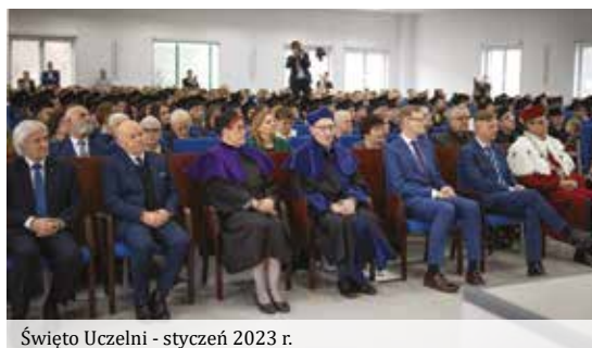
Święto Uczelni - styczeń 2023 r.