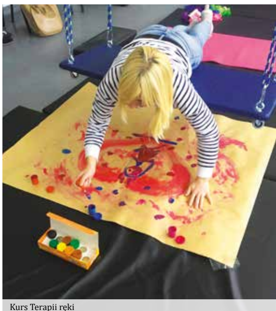
Kurs Terapii ręki