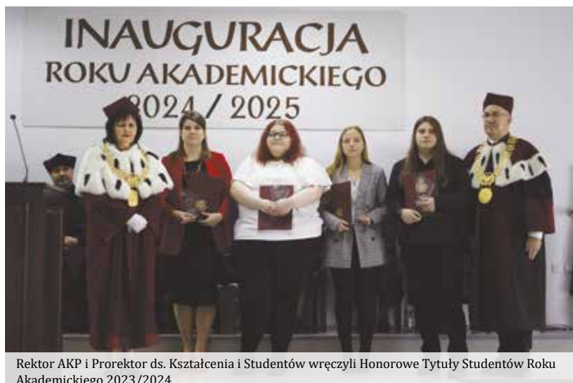
Rektor AKP i Prorektor ds. Kształcenia i Studentów wręczyli Honorowe Tytuły Studentów Roku Akademickiego 2023/2024

Widząc tak wspaniałe efekty można być dumnym i wspomagać innych w osiągnięciu podobnych sukcesów.