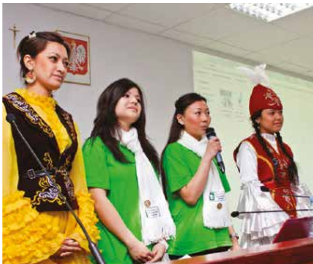
Studentki z Kazachstanu prezentują obyczaje swojego kraju