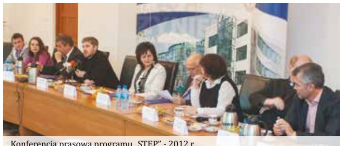
Konferencja prasowa programu „STEP” - 2012 r.