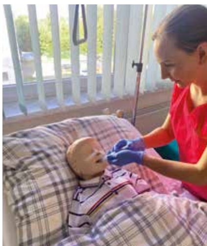
Zajęcia praktyczne z opieki nad małym pacjentem

Program studiów, przygotowany zgodnie ze standardami obowiązującymi w Unii Europejskiej, zapewnia studentom zdobycie szerokiej, wszechstronnej wiedzy oraz umiejętności, jak i pełnego przygotowania zawodowego do zatrudnienia we wszystkich obszarach pielęgniarstwa zarówno w kraju, jak i zagranicą. Kształcenie na tym kierunku studiów powierzono grupie doświadczonych wykładowców z doskonałym dorobkiem naukowym i wieloletnim doświadczeniem praktycznym.