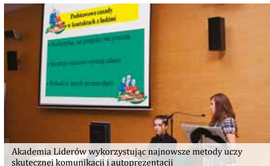
Akademia Liderów wykorzystując najnowsze metody uczy skutecznej komunikacji i autoprezentacji

Zespół Akademii Liderów AKP wyznaje zasadę rozwoju przez całe życie, niezależnie od wykształcenia, wieku i wykonywanej pracy. Specjaliści starają się w sugestywny sposób przekazać wiedzę i doświadczenie, tak aby uzmysłowić odbiorcy, iż każdy może stać się liderem i kreatorem swojego życia osobistego i zawodowego. Program zajęć Akademii został tak skonstruowany, aby wzbogacić uczestników w wiedzę, umiejętności praktyczne dotyczące komunikacji, nawiązywania kontaktów i relacji interpersonalnych, a przede wszystkim by nauczyć ich wiary we własne umiejętności i siły. Tym samym – cała działalność Akademii Liderów stanowi konkretną propozycję walki ze słabymi, obecnie występującymi stronami stanu edukacji. Zespół Akademii wskazuje przede wszystkim na niezadowalający poziom rozwoju przedsiębiorczości w szkołach, niewystarczające umiejętności młodzieży w wykorzystaniu instrumentów rynku pracy, brak liderów dla małych i średnich przedsiębiorstw oraz niewystarczające powiązania pomiędzy pracodawcami a systemem edukacji.