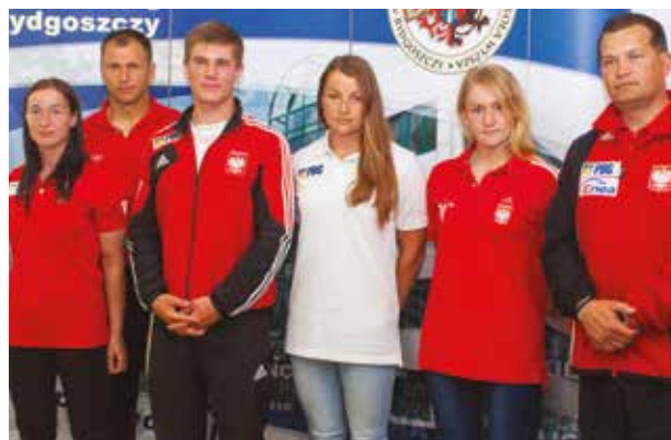
Stypendyści Uczelni - kajakarze CWZS Zawisza

Od 2007 roku Uczelnia przyznaje stypendia sportowe, których