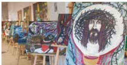
Wystawa prac malarskich K. Pawłowskiego zorganizowana podczas Zjazdu Wydziału Opieki Postpenitencjarnej UM „Omega” - 2013 r.

Platformą odniesienia dla konceptualizacji i utworzenia Uniwersytetu Międzypokoleniowego „OMEGA” był Uniwersytet Dzieci „ALFA”, gdzie w „uniwersyteckim” trybie kształcenia uczą się od siebie dzieci i zaproszeni przez nich partnerzy, jednocześnie pełniąc funkcje akademickie i wzrastając w dostojeństwo uniwersytetu i jego misję kulturową.