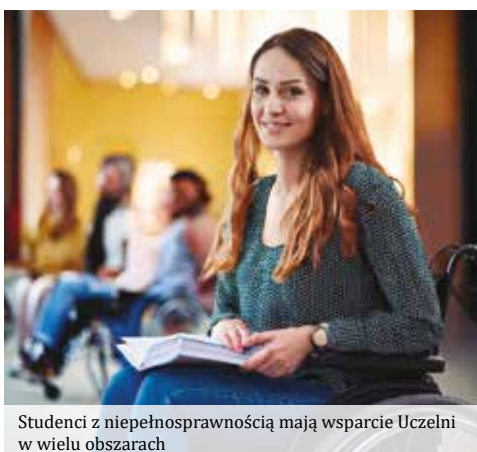
Studenci z niepełnosprawnością mają wsparcie Uczelni w wielu obszarach

Akademia Kujawsko-Pomorska od 2000 roku zgodnie z jasno ukierunkowaną misją realizuje postulat Sapientiae Servientes - w służbie mądrości. Konsekwentnie podejmuje działania na rzecz inkluzji osób zagrożonych wykluczeniem społecznym i pomocy osobom w potrzebie. Wszelkie pomysły realizowane przez Władze, pracowników, studentów oraz sympatyków Uczelni mają na uwadze przede wszystkim troskę o drugiego człowieka, jego rozwój i poczucie równego traktowania w życiu studenckim i zawodowym. Stąd też od 2012 roku w ramach Akademii Kujawsko-Pomorskiej działa Biuro ds. Osób Niepełnosprawnych, które w swej idei ma połączyć i usprawnić licznie prowadzone działania na rzecz osób z niepełnosprawnością. Holistyczna troska o człowieka z niepełnosprawnością ujawnia się w realizacji zadań w kilku obszarach.