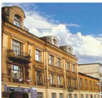
Pierwsza siedziba Uczelni przy ul. E. Warmińskiego 3 - 2000 r.