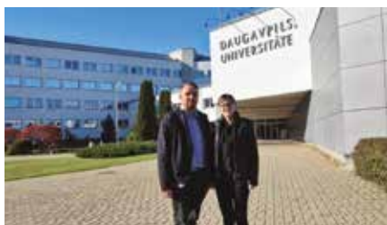
Wykładowcy AKP na Daugavpils University, Łotwa

Ważnym elementem procesu kształcenia na Uczelni jest formowanie i wzmacnianie kompetencji międzykulturowych wśród studentów i pracowników. Od roku akademickiego 2013/2014 rozpoczęto wdrażanie kształcenia modułowego. Studenci mogą pogłębić swoją wiedzę podczas zajęć dodatkowych w ramach proponowanych modułów. Moduły, m.in. edukacji międzykulturowej, kanonu kultury europejskiej, warsztatów międzykulturowych zapewniają długofalowe oddziaływanie na kształtowanie tej kluczowej i niezbędnej w coraz bardziej zglobalizowanym społeczeństwie kompetencji. Zajęcia odbywają się w językach: polskim, angielskim, ukraińskim, zapewniając możliwość wspólnego uczestnictwa studentów polskich i zagranicznych. Wspieranie rozwoju dialogu międzykulturowego, dyseminacja i transfer dobrych praktyk, kształtowanie świadomości społecznej w tym zakresie zapewniają stałe kreowanie modelu społeczeństwa różnorodnego a jednocześnie zintegrowanego. W strukturze Uczelni powstało wiele jednostek, które wspomagają aktywność międzynarodową, jak np. Międzynarodowe Centrum Nauki i Edukacji, Centrum Współpracy z Zagranicą, Centrum dla Studentów Zagranicznych, Klub Integracyjny, Szkoła Języka Polskiego i Kultury Polskiej COLLEGIUM POLONICA i Szkoła Języków Obcych.