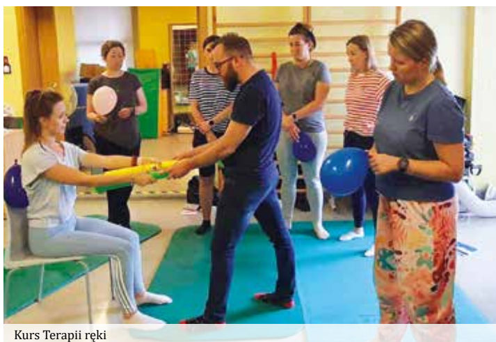
Kurs Terapii ręki