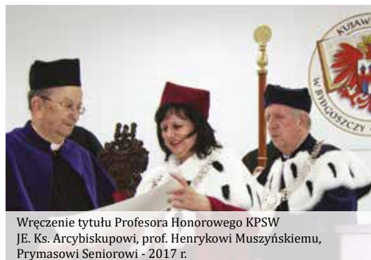
Wręczenie tytułu Profesora Honorowego KPSW JE. Ks. Arcybiskupowi, prof. Henrykowi Muszyńskiemu, Prymasowi Seniorowi - 2017 r.