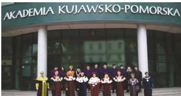
Senat Akademii Kujawsko-Pomorskiej - 2023 r.

w językach obcych, a także organizację szeroko zakrojonych inicjatyw o charakterze międzynarodowym, • budowaniu partnerstw strategicznych i sieci międzynarodowych, które pozwalają na przeprowadzenie zaawansowanych prac i wymianę poglądów na poszczególne zagadnienia, istotne dla dalszego rozwoju szkolnictwa wyższego. Na kartach historii AKP wyraźnie widać odzwierciedlenie idei „Sapientiae Servientes”. Uczelnia nie działa w próżni, stara się sprostać rozwojowi cywilizacji i realizuje wyznaczoną misję. Fundamentem działalności człowieka jest właśnie mądrość, stąd też trafnym wyborem jest jej służyć.