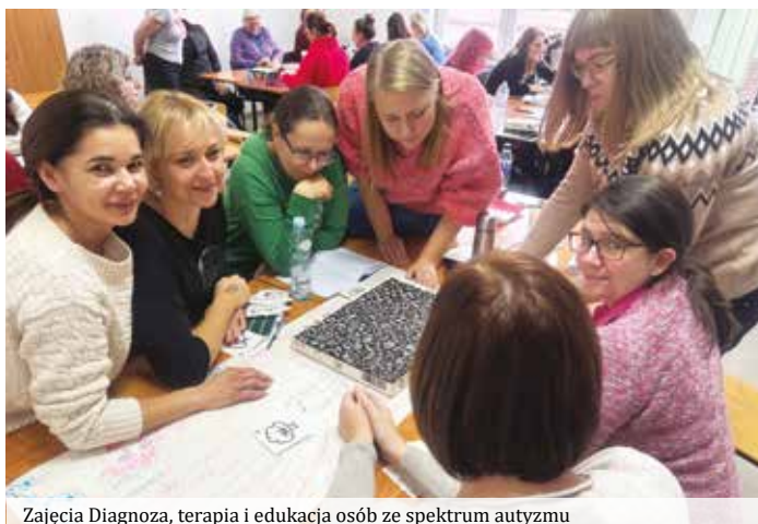
Zajęcia Diagnoza, terapia i edukacja osób ze spektrum autyzmu