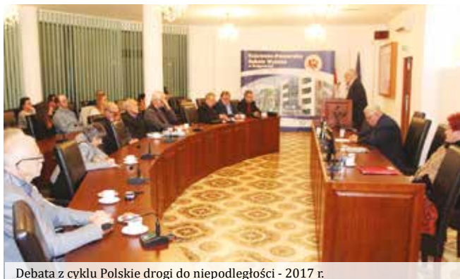
Debata z cyklu Polskie drogi do niepodległości - 2017 r.

Wszystkie organizowane i współorganizowane, zarówno z krajowymi jak i zagranicznymi partnerami, konferencje są doskonałą okazją do spotkania wielu wybitnych specjalistów i praktyków