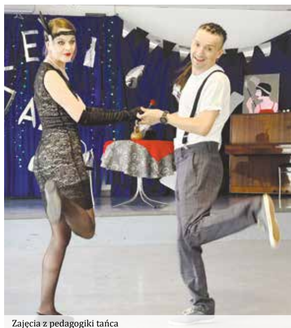
Zajęcia z pedagogiki tańca