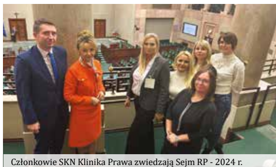
Członkowie SKN Klinika Prawa zwiedzają Sejm RP - 2024 r.

zazwyczaj kwestie drobnych, bieżących spraw życia codziennego mieszkańców Bydgoszczy i regionu, m. in.: redagowanie pism procesowych, wniosków oraz innych dokumentów kierowanych do sądów powszechnych oraz organów administracji. Klinika realizuje Program Edukacyjny „Prawo na co dzień”, w ramach którego studenci w porozumieniu z dyrekcjami szkół ponadgimnazjalnych prowadzą warsztaty dla uczniów. Owocem wzmożonej aktywności naukowej zespołu Kliniki Prawa jest organizacja studenckiej, cyklicznej konferencji naukowej „Współczesne problemy prawa”. Klinikę wspierają wybitni eksperci, praktycy, prowadząc warsztaty, umożliwiające zgłębianie wiedzy z zakresu różnych gałęzi prawa. Kliniki Prawa rozszerzyła swoją działalność edukacyjną, inicjując współpracę z młodzieżą szkół bydgoskich, będącą beneficjentem programu „Zdolni znad Brdy”. Natomiast dzięki kooperacji z Diecezjalną Poradnią Specjalistyczną w Diecezji Bydgoskiej, Klinika ma ułatwione dotarcie do osób szczególnie potrzebujących pomocy. Ten innowacyjny projekt Uczelni, to wspaniała sposobność dla mieszkańców Bydgoszczy i regionu, zmierzająca do spotęgowania ich świadomości prawnej oraz wprowadzenia w arkana nauk jurystycznych.