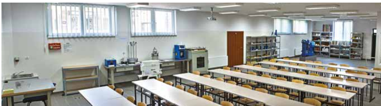
Studenci ćwiczą na najnowszych urządzeniach w laboratorium technicznym

Dużym atutem AKP jest jej nowoczesna, własna baza o powierzchni około 15 tysięcy metrów kwadratowych. Infrastruktura dydaktyczna Akademii Kujawsko-Pomorskiej została doceniona przez Polską Komisję Akredytacyjną, która przyznała jej ocenę wyróżniającą. Uczelnia zlokalizowana jest w trzech dużych obiektach usytuowanych w samym centrum miasta, położonych od siebie w niewielkiej odległości. Każdy z nich dostosowano do potrzeb osób z różnego rodzaju niepełnosprawnościami.