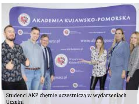
Studenci AKP chętnie uczestniczą w wydarzeniach Uczelni

Samorząd jest głosem społeczności studenckiej Uczelni. Jego członkowie uczestniczą w podejmowaniu wielu istotnych decyzji, m.in.: biorąc udział w posiedzeniach Senatu Uczelni, Komisjach Stypendialnych i Dyscyplinarnych oraz Uczelnianej Komisji Wyborczej. Kreują życie studenckie, są pomysłodawcami i organizatorami wielu wydarzeń o charakterze naukowym, kulturalnym i sportowym, organizują, np.: kulturalia, juwenalia, wernisaże, wystawy, koncerty. Należy również podkreślić, że Samorząd Studencki uczestniczy w akcjach charytatywnych i pomocowych na rzecz środowiska lokalnego, m.in.: poprzez włączenie się w Ogólnopolską Akcję Charytatywną „Pomóż dzieciom przetrwać zimę”, tradycyjny mecz słodkich serc, organizowany przy współpracy z Klubem Sportowym Astoria. Zebrano wówczas 220 kg darów, które zostały przekazane w formie paczek świątecznych podopiecznym świetlic środowiskowych w Bydgoszczy. Warto również wspomnieć zbiórkę