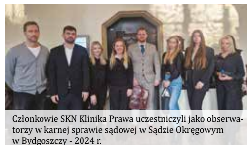
Członkowie SKN Klinika Prawa uczestniczyli jako obserwatorzy w karnej sprawie sądowej w Sądzie Okręgowym w Bydgoszczy - 2024 r.

Klinika Prawa utworzona została w 2013 roku na wyraźne zapotrzebowanie społeczne oraz w związku z aktywnością i wolą społeczności akademickiej AKP. Jej działalność idealnie wpisuje się w realizowaną przez Uczelnię i jej struktury wydziałowe misję. Poprawne rozumienie litery prawa nie zawsze jest jednoznaczne i klarowne. Klinika postawiła sobie zatem za cel złagodzenie „dolegliwości” społecznych związanych z interpretacją prawniczego języka i paragrafów. Podstawowym zamierzeniem pionierskiej, tego typu inicjatywy w Bydgoszczy, jest pomoc wszystkim, którzy z różnych przyczyn, bezpośrednio nie mogą skorzystać z pomocy radców prawnych czy adwokatów. Jest to cenna inicjatywa społeczna, pozwalająca zdobyć doświadczenie, przygotowanie praktyczne, a także stanowi bogate podłoże dla kształtowania właściwych postaw obywatelskich i charakteru. Studenci AKP pod opieką merytoryczną i koordynacją nauczycieli akademickich zatrudnionych na Wydziale Nauk Prawnych, Społecznych i Humanistycznych, udzielają nieodpłatnych porad prawnych. Zakres pomocy do