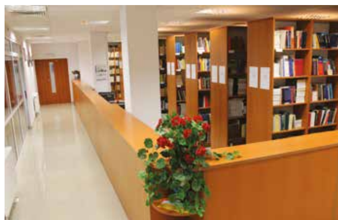
... i wypożyczalnia Biblioteki przy ul. Toruńskiej 55-57