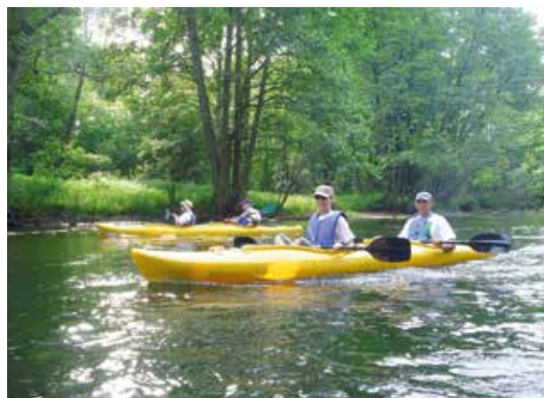
Uczestnicy Kajakowego Spływu Papieskiego

promuje rozwój turystyki kajakowej na Brdzie oraz na innych szlakach wodnych naszego regionu. Jej głównym zadaniem jest propagowanie aktywnej rekreacji połączonej z kontemplacją przyrody w duchu nauki papieskiej. Spływ promuje także aktywność sportowo-rekreacyjną, która służy profilaktyce zdrowotnej, adresowany jest do społeczności akademickich, młodzieży oraz mieszkańców Bydgoszczy i regionu.