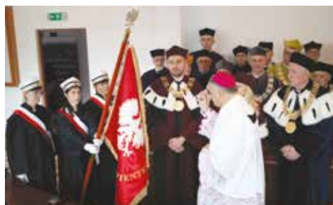
Poświęcenie sztandaru Akademii Kujawsko-Pomorskiej - 2023 r.

Zmiana nazwy Uczelni związana była także ze zmianą sztandaru.