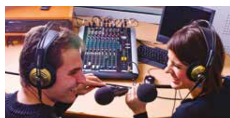
oraz Akademickie Radio „Megafon” relacjonują wszystkie ważne uroczystości Uczelni

uczelni na polu kształtowania szeroko rozumianej świadomości społecznej.