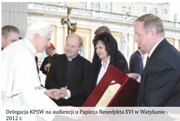
Delegacja KPSW na audyencji u Papieża Benedykta XVI w Watykanie - 2012 r.

W 2012 roku Senat Uczelni przyznał swoje najwyższe wyróżnienie – tytuł Profesora Honorowego Ks. Kardynałowi Prof. Tarcisio Bertone, Sekretarzowi Stanu Stolicy Apostolskiej za pontyfikatu Benedykta XVI, wybitnemu uczonemu w zakresie prawa kanonicznego, teologii moralnej i filozofii prawa. Uroczystość zbiegła się z otwarciem Centrum Studiów Ratzingera, którego siedzibą jest AKP. Władze Uczelni otrzymały medal od Ks. Kardynała jako wyraz wdzięczności za współpracę.