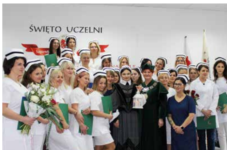
Ceremonia „czepkowania” absolwentów pielęgniarstwa studiów licencjackich I stopnia kierunku Pielęgniarstwo wraz z Florence Nightingale – pionierką nowoczesnego pielęgniarstwa oraz Dziekan Wydziału Nauk Medycznych podczas Święta Uczelni - 2024 r