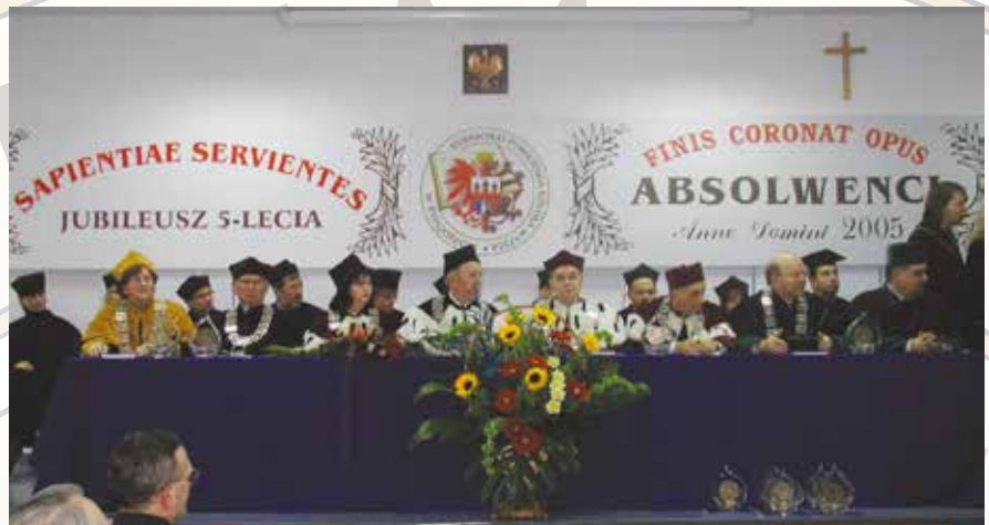
Poczet sztandarowy Kujawsko-Pomorskiej Szkoły Wyższej w Bydgoszczy, obchody Jubileuszu 5-lecia Uczelni - 2005 r.