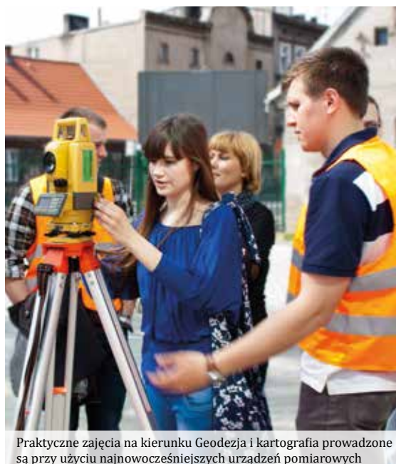
Praktyczne zajęcia na kierunku Geodezja i kartografia prowadzone są przy użyciu najnowocześniejszych urządzeń pomiarowych