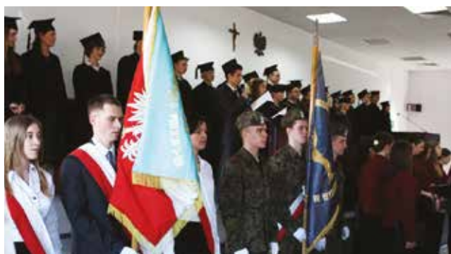
Inauguracja Akademii Spraw Publicznych „Iuvenes Pro Publico Bono”

Akademia Spraw Publicznych „Iuvenes Pro Publico Bono” powstała pod nadzorem ówczesnego Wydziału Nauk Społecznych i Filologicznych we współpracy z bydgoskimi szkołami: Zespołem Szkół Ogólnokształcących nr 1, Zespołem Szkół Ogólnokształcących nr 7, Zespołem Szkół nr 4 oraz Zespołem Szkół Medycznych. Zadania w ramach Akademii realizowane są w trybie ponadstandardowego kształcenia, tutoringu edukacyjnego i mentoringu akademickiego w zakresach tematycznych w ramach struktur zwanych KOLEGIAMI (jest to koordynujący zespół rekrutujący się z nauczycieli i uczniów, wykładowców i studentów). Kolegium jest otwarte dla wszystkich liceów i gimnazjów. W 2014 r. Akademia otrzymała dyplom od Prezydenta Bydgoszczy Rafała Bruskiego za zaangażowanie i aktywny udział w Europejskim Tygodniu Demokracji Lokalnej.