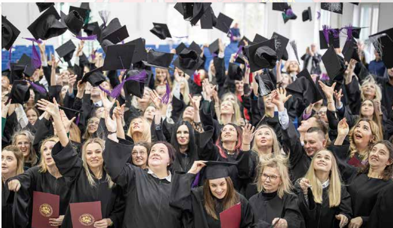
Absolwenci Akademii Kujawsko-Pomorskiej

Niniejsza oferta nie stanowi oferty handlowej w rozumieniu art. 66 § 1 kodeksu cywilnego oraz innych właściwych przepisów prawnych.