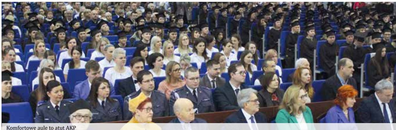
Komfortowe aule to atut AKP