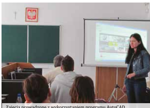
Zajęcia prowadzone z wykorzystaniem programu AutoCAD