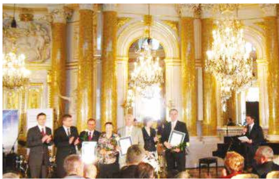
Wicekanclerz Uczelni odbiera pierwszą nagrodę w ogólnopolskim konkursie „Lodołamacze” na Zamku Królewskim w Warszawie - 2011 r.

KPSW została także pierwszym laureatem ogólnopolskiego konkursu „Dobre Stypendia 2010”, organizowanego przez Polsko-Amerykańską Fundację Wolności i Fundację Moje Stypendium. Kapituła konkursu doceniła przyznawane studentom stypendia AKP ze środków własnych Uczelni.