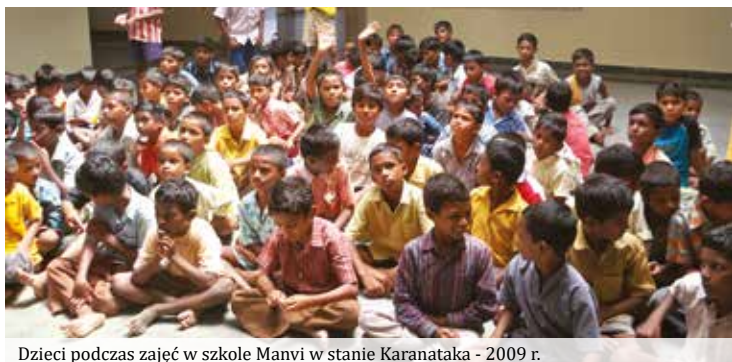
Dzieci podczas zajęć w szkole Manvi w stanie Karanataka - 2009 r.

Ponadto w ramach inicjatyw krajowych prowadzony jest wolontariat we współpracy z wieloma ośrodkami pomocy społecznej na rzecz dzieci, osób starszych i niepełnosprawnych.