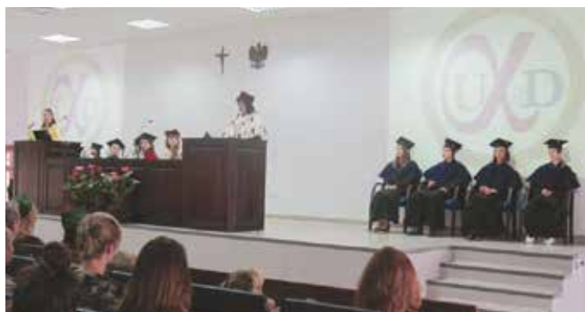
Rektor KPSW podczas inauguracji Uniwersytetu Dzieci „Alfa” - 2013 r.