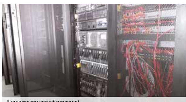
Nowoczesny sprzęt pracowni

Kurs CCNP oferuje kontynuację szkolenia i pogłębianie wiedzy w ramach trzech modułów, obejmujących zaawansowane zagadnienia sieciowe. Dzięki utworzeniu Akademii, AKP dołączyła do grona ośrodków, zlokalizowanych na całym świecie, oferujących certyfikaty CISCO. W celu zapewnienia wysokiego poziomu kształcenia, wszystkie Akademia CISCO, opracowały jednolity schemat nauczania. Dzięki temu Certyfikaty CISCO uznawane są na całym świecie, niezależnie od lokalizacji Akademii, w której kurs został ukończony.