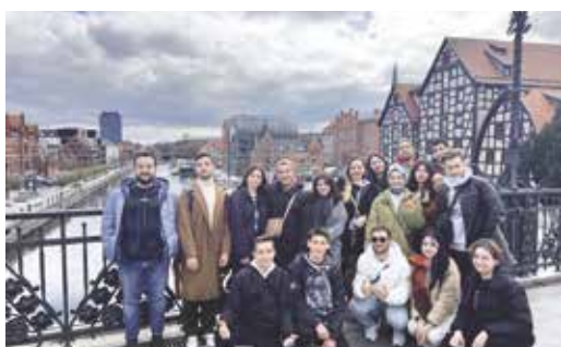
Studenci Erasmusa zwiedzają Bydgoszcz -2023 r.

Centrum powołano w celu realizacji szeroko rozumianej współpracy z uczelniami i instytucjami zagranicznymi, wymiany doświadczeń na wielu polach oraz krzewienia polskiej kultury za granicą. Jednostka ta została uwzględniona w Planie Rozwoju Lokalnego Miasta Bydgoszczy i jest częścią projektu pt. „Miasto nauki”. MCNiE realizuje projekty unijne, zajmuje się organizowaniem międzynarodowych konferencji, a także stwarza niezbędne warunki do kształcenia studentów z zagranicy, przygotowuje i wdraża programy studiów w języku angielskim. Co roku studenci zagraniczni korzystają z semestralnych bądź rocznych programów kształcenia w języku angielskim oraz dodatkowych zajęć rozwijających ich kompetencje językowe i międzykulturowe.