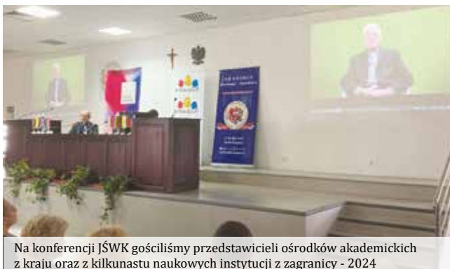
Na konferencji JŚWK gościliśmy przedstawicieli ośrodków akademickich z kraju oraz z kilkunastu naukowych instytucji z zagranicy - 2024

Sukces tej konferencji odbił się szerokim echem w mediach oraz wśród specjalistów owej tematyki. Poddało to organizatorom pomysł, który już wszedł w fazę realizacji, aby konferencja ta organizowana była cyklicznie.