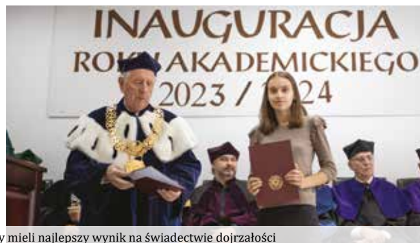
mieli najlepszy wynik na świadectwie dojrzałości