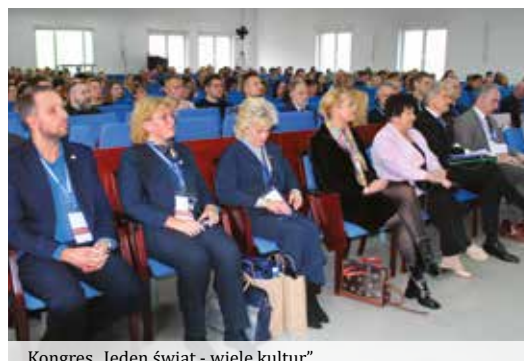
Kongres „Jeden świat - wiele kultur”