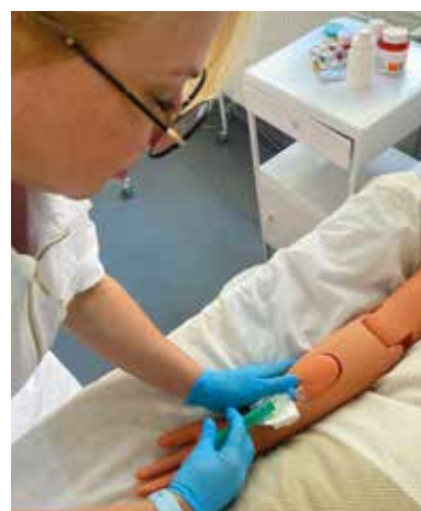
Zajęcia praktyczne na kierunku Pielęgniarstwo

Pamiętamy o przesłaniu prekursorki nowoczesnego pielęgniarstwa Florence Nightingale sprzed ponad stu lat, które nie straciło nic na swojej aktualności i mocy: Jeśli człowiek rodzi się ze skrzydłami, powinien zrobić wszystko, żeby się nimi posłużyć i latać.