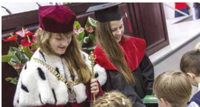
Inauguracja roku akademickiego Uniwersytetu Dzieci „Alfa” - 2013 r.

W ramach „ALFY” działa osiem wydziałów: Wydział Humanistyczno-Lingwistyczny, Wydział Kreatywności, Innowacji i Przedsiębiorczości, Wydział Matematyczno-Techniczny, Wydział Przyrodniczo-Podróżniczy, Wydział Sztuki i Twórczości Artystycznej, Wydział Promocji Zdrowia i Sportu, Wydział Aktywnej Rehabilitacji i Promocji Ruchu Dziecka, Wydział Treningów Sprawnościowych.