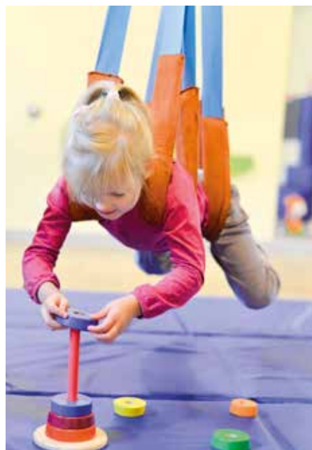
Zajęcia z integracji sensorycznej

Dążymy do pełnej aktualizacji naszej oferty programowej tak, aby służyła ludziom i rozwojowi społeczno – gospodarczemu naszego regionu.