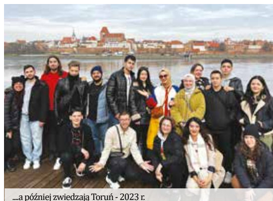
...a później zwiedzają Toruń - 2023 r.

Akademia Kujawsko-Pomorska dynamicznie rozwija proces umiędzynarodowienia kształcenia, wpisując się w globalne trendy edukacyjne. Uczelnia aktywnie uczestniczy w programie Erasmus+, który stanowi fundament międzynarodowej współpracy akademickiej. Dzięki temu programowi wykładowcy i studenci mają możliwość zdobywania doświadczenia zawodowego oraz rozwijania kompetencji językowych i kulturowych w krajach partnerskich. Uczelnia podpisała liczne umowy z zagranicznymi instytucjami edukacyjnymi, jak również przedsiębiorstwami, co przyczyniło się do wymiany studentów oraz kadry naukowej, a także do wspólnych projektów badawczych. Inicjatywy te nie tylko wzbogacają ofertę edukacyjną, ale także podnoszą prestiż AKP na arenie międzynarodowej, sprzyjając integracji akademickiej społeczności oraz promując różnorodność kulturową w życiu uczelni. Umiędzynarodowienie kształcenia w Akademii Kujawsko-Pomorskiej to zatem nie tylko szansa na rozwój osobisty i zawodowy pracowników i studentów, ale także istotny krok w kierunku budowania silnych międzynarodowych relacji i współpracy naukowej.