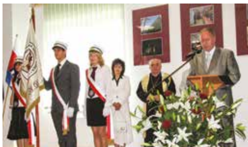
Poświęcenie budynku przy ul. Toruńskiej 55-57 przez Jego Eksceleńcję ks. Biskupa Jana Tyrawę Ordynariusza Diecezji Bydgoskiej - 2008 r.

Od początku istnienia, tj. od 2000 roku, Uczelnia funkcjonuje na zasadach NON-PROFIT, co oznacza, że nie osiąga zysku, a wypracowane fundusze przeznaczone są na rozwój i nowe inwestycje. Akademia Kujawsko-Pomorska posiada również pozostałe cechy właściwe dla organizacji non-profit, tj.: wyrazistą i trwałą strukturę organizacyjną, strukturalną niezależność od władz publicznych, samorządność oraz dobrowolność.