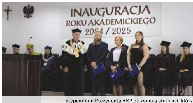
Stypendium Prezydenta AKP otrzymują studenci, którzy