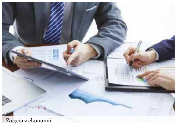
Zajęcia z ekonomii