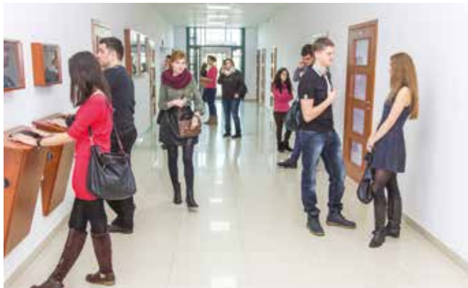
Nowoczesne przestrzenie AKP