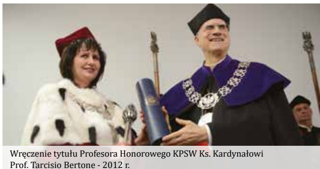
Wręczenie tytułu Profesora Honorowego KPSW Ks. Kardynałowi Prof. Tarcisio Bertone - 2012 r.

Seniorowi oraz wieloletniemu członkowi komitetu naukowego konferencji „Jeden świat – wiele kultur”, tytułu Profesora Honorowego Kujawsko-Pomorskiej Szkoły Wyższej w Bydgoszczy.