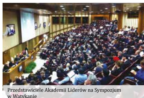
Przedstawiciele Akademii Liderów na Sympozjum w Watykanie

Nauczyciele - eksperci z wielu dziedzin, stosują metody aktywizujące uczestników warsztatów oraz umożliwiające kontakt z najlepszymi pracodawcami w regionie. Poprzez udział w międzynarodowych konferencjach naukowych zdobywają umiejętność efektywnego, dostosowanego do aktualnych potrzeb, prezentowania własnych pomysłów i prac badawczych.