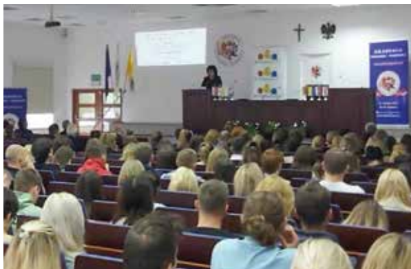
Studenci AKP na konferencji „Jeden Świat - wiele kultur”

Obecnie na wydziale kształcenie odbywa się na: 5-letnich jednolitych studiach magisterskich, magisterskich (2-letnich) oraz licencjackich (3-letnich).