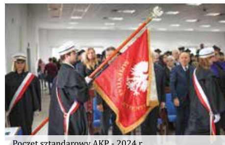
Poczet sztandarowy AKP - 2024 r.