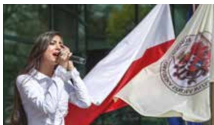
Studentzi z Erasmusa uczestniczą w inicjatywach AKP