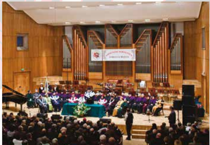
Gala w Filharmonii Pomorskiej w Bydgoszczy - obchody Jubileuszu 10-lecia Uczelni - 2010 r.