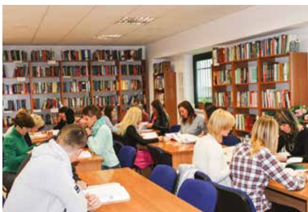
Czytelnia Biblioteki przy ul. Toruńskiej 55-57