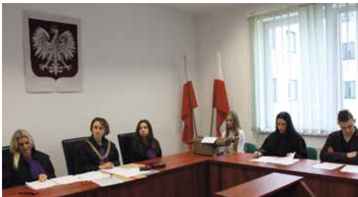
Studenci AKP podczas symulacji rozprawy sądowej na sali rozpraw