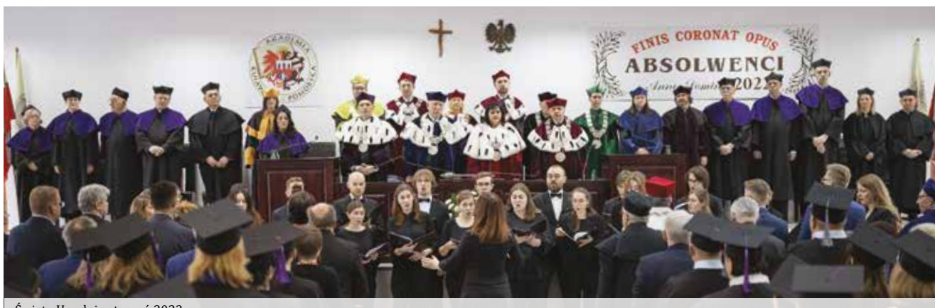
Święto Uczelni - styczeń 2023 r.