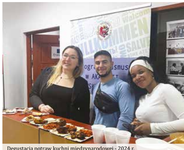
Degustacja potraw kuchni międzynarodowej - 2024 r.

W celu intensyfikacji umiędzynarodowienia studiów oraz popularyzacji nauki, kultury i sztuki, a także promocji najważniejszych osiągnięć naukowych Uczelni i jej partnerów, AKP organizuje cykliczne spotkania naukowe i imprezy popularnonaukowe takie jak Międzynarodowe Otwarte Dni Nauki. Od 2012 roku inicjatywa ta wpisana się na stałe do kalendarza imprez międzynarodowych Uczelni. Jednym z celów przedsięwzięcia jest rozwój dialogu międzykulturowego i społecznego jako działanie zapobiegające dyskryminacji i sprzyjające kształtowaniu postaw otwartości na różnorodność kulturową oraz kształtowanie świadomości kulturowej. Program Międzynarodowych Otwartych Dni Nauki jest tworzony we współpracy z partnerami zagranicznymi, wieloma instytucjami, jednostkami edukacyjnymi oraz kulturalnymi, jak również przedstawicielami biznesu. W ofercie MODN znaleźć można, m.in.: popularnonaukowe wykłady otwarte prowadzone przez wybitnych naukowców z kraju i zagranicy oraz przedstawicieli biznesu, interdyscyplinarne warsztaty, treningi, lekcje i zajęcia dla studentów, nauczycieli, dzieci i seniorów, konkursy naukowe oraz artystyczne, sesje klubów dyskusyjnych, sympozja naukowe, imprezy interkulturowe i integracyjne, organizowane przez studentów i nauczycieli zagranicznych, turnieje sportowe z udziałem międzynarodowych drużyn.