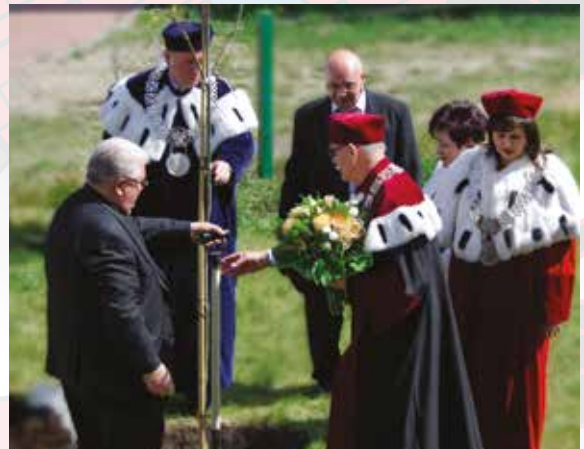
Władze Uczelni przy akompaniamencie 50-osobowej Orkiestry Dętej Miejsko-Gminnego Ośrodka Kultury w Koronowie składają kwiaty pod pomnikiem Walki i Męczeństwa na Starym Rynku w Bydgoszczy, sadzenie Jubileuszowego Dębu na Kampusie Uczelni - obchody Jubileuszu 15-lecia Uczelni - 2015 r.