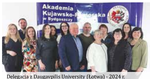
Delegacja z Daugavpilis University (Łotwa) - 2024 r.