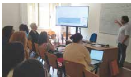
Wykład na University of Cagliari, Włochy