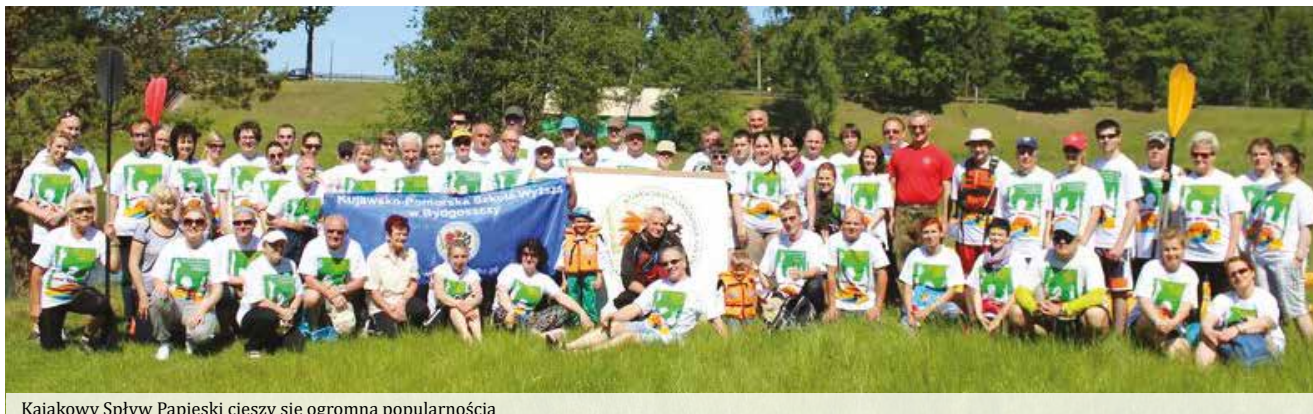
Kajakowy Spływ Papieski cieszy się ogromną popularnością