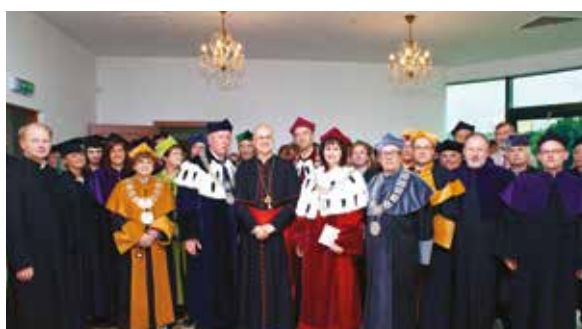
Senat Uczelni, przedstawiciele Akademii Liderów z Ks. Kardynałem prof. Tarcisio Bertone - otwarcie Centrum Studiów Ratzingera - 2012 r.