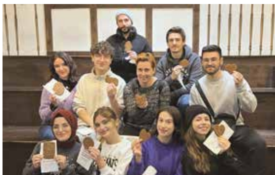
Studenci Erasmusa chętnie uczestniczą w piernikowych zajęciach integracyjnych...

Niezmiernie ważnym elementem procesu internacjonalizacji Uczelni jest uczestnictwo w programie Erasmus+. To dzięki tej inicjatywie transfer dobrych praktyk i innowacji nabrał realnego wymiaru. Systematyczna realizacja mobilności kadry akademickiej oraz studentów, którzy stają się nośnikami sprawdzonych rozwiązań, przyczyniła się do modyfikacji treści programowych kształcenia i wdrażania nowych standardów, dostosowanych do zglobalizowanego rynku pracy poprzez promowanie uczestnictwa w programie. Uczelnia zachęca do świadomego kształtowania europejskiej ścieżki zawodowej oraz ustawicznej aktualizacji kompetencji i umiejętności. Uczelnia posiada Kartę Programu Erasmus+ na lata 2021 -2027, a w programie uczestniczy od 2004 roku. W ramach programu Erasmus+ możliwa jest wymiana wykładowców, pracowników administracyjnych oraz studentów. Daje to takie same możliwości jak wszystkim uczelniom państwowym. Wymiana kadry AKP jest aktywnie realizowana. Co semestr przyjmowane są liczne grupy cudzoziemców od 10 do 25 osób głównie z Turcji, Hiszpanii, Włoch, Litwy czy Portugalii.