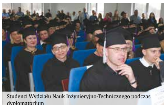
Studenci Wydziału Nauk Inżynieryjno-Technicznego podczas dyplomatorium