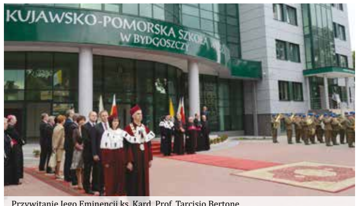
Przywitanie Jego Eminencji ks. Kard. Prof. Tarcisio Bertone