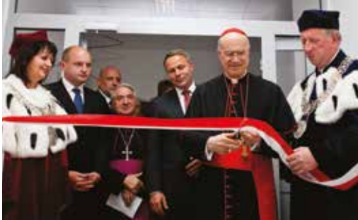
Otwarcie Centrum Studiów Ratzingera w 11 czerwca 2012 r.

Fundacja Watykańska Joseph Ratzinger – Benedykt XVI została utworzona 1 marca 2010 roku na polecenie Papieża Benedykta XVI. Stała się ona jednocześnie odpowiedzią na liczne głosy wielu uczonych, którzy wyrażali chęć powołania instytucji, zajmującej się drukowaniem, rozpowszechnianiem i studiami tekstów pisanych Profesora Józefa Ratzingera, późniejszego Papieża.