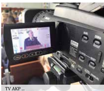
TV AKP ...

W ramach struktur Akademii Kujawsko-Pomorskiej funkcjonuje Akademickie Radio Internetowe „Megafon”. Celem rozgłośni jest dostarczanie rozrywki, budowanie więzi społecznych, pozytywne oddziaływanie na rzeczywistość społeczną, promowanie nauki i kultury oraz szkolenie młodzieży licealnej i studentów w zakresie zawodu dziennikarza. W celu wzmocnienia procesu realizacji tych założeń Władze Uczelni oddały do dyspozycji studentów profesjonalne studio telewizyjne. Swoją działalność emisyjną rozpoczęła Akademicka Internetowa TV AKP. Zarówno Radio Megafon jak i TV AKP uczestniczą czynnie w ważnych wydarzeniach w regionie i kraju, promują lokalnych oraz krajowych artystów oraz współpracują z kadrą naukową Akademii Kujawsko-Pomorskiej i innych