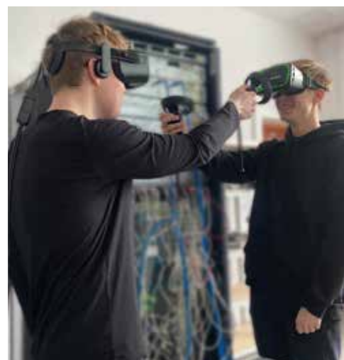
Zajęcia praktyczne na kierunku Informatyka