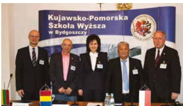
Rektorzy podpisują porozumienie powołujące Międzynarodowe Konsorcjum Rektorów i Prezydentów Uniwersytetów i Uczelni Wyższych - 2013 r.

Jednym z założeń wpisanych w misję Uczelni jest budowanie dialogu międzykulturowego. AKP jest organizatorem wielu przedsięwzięć o charakterze międzynarodowym, które wspomagają dialog i kreowanie modelu społeczeństwa wielokulturowego, ale jednocześnie zintegrowanego. W roku 2013 w IV Międzynarodowej Konferencji Interdyscyplinarnej z cyklu „Jeden świat – wiele kultur” udział wzięli rektorzy i przedstawiciele uniwersytetów, instytucji rządowych oraz otoczenia biznesu, m.in. z Turcji, Grecji, Węgier, Rumunii, Włoch, Rosji, Ukrainy, Kirgistanu i Kazachstanu. Tej edycji konferencji towarzyszyło podpisanie porozumienia powołującego Międzynarodowe Konsorcjum Rektorów i Prezydentów Uniwersytetów i Uczelni Wyższych w oparciu o Międzynarodową Sieć Uniwersytetów i Szkół Wyższych. Członkowie Konsorcjum realizują współpracę w zakresie podejmowania wspólnych przedsięwzięć w obszarze działalności nau-