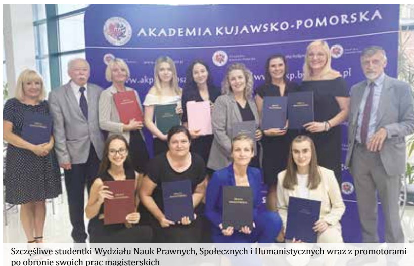
Szczęśliwe studentki Wydziału Nauk Prawnych, Społecznych i Humanistycznych wraz z promotorami po obronie swoich prac magisterskich

Kierunek praca socjalna adresowany jest do osób zainteresowanych zdobyciem wszechstronnej wiedzy, umiejętności i kompetencji z zakresu różnorodnych form, mechanizmów i metod pomocy społecznej skierowanej do jednostek i grup dotkniętych trudną sytuacją życiową, znajdujących się w kryzysie, bezrobotnych, wykluczonych społecznie, zagrożonych marginalizacją, przemocą, uzależnionych od substancji psychoaktywnych. Ten prestiżowy kierunek łączy w sobie wiedzę z zakresu wielu dyscyplin społecznych, humanistycznych, medycznych, ekonomicznych oraz polityki społecznej, co pozwala na diagnozowanie różnych sytuacji problemowych, w których znaleźć się może jednostka, grupa i społeczność lokalna, oraz projektowanie zmian i ich wprowadzanie. Kierunek tworzą znani specjaliści i praktycy z instytucji pomocowych i społecznych, którzy mając na uwadze profesjonalizm, kompetencje i wiedzę przyszłych pracowników socjalnych z wielką starannością dobierają treści merytoryczne do aktualnych potrzeb pomocy społecznej. Kierunek wyróżnia się, m.in. takimi atutami jak: wyspecjalizowana kadra, adekwatność kształcenia do potrzeb rynku pracy, nowatorstwo prowadzonych zajęć (zgodnie z projektem nowelizacji ustawy o pomocy społecznej). Studia na kierunku praca socjalna dają możliwość zdobycia tytułu licencjata a także dalszego kształcenia na studiach magisterskich i podyplomowych.