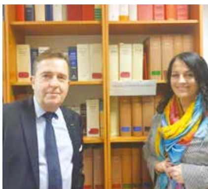
Konsul Honorowy Niemiec i Dyrektor Biblioteki

AKP, jako druga, zaraz po UMK w Toruniu, uczelnia w regionie podpisała umowę depozytu bibliotecznego z Konsulem Honorowym Niemiec w Bydgoszczy. Konsekwencją tego było utworzenie w Bibliotece AKP, Małej Biblioteki Prawa Niemieckiego , której zbiory deponent sukcesywnie powiększa.