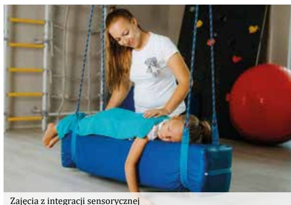
Zajęcia z integracji sensorycznej