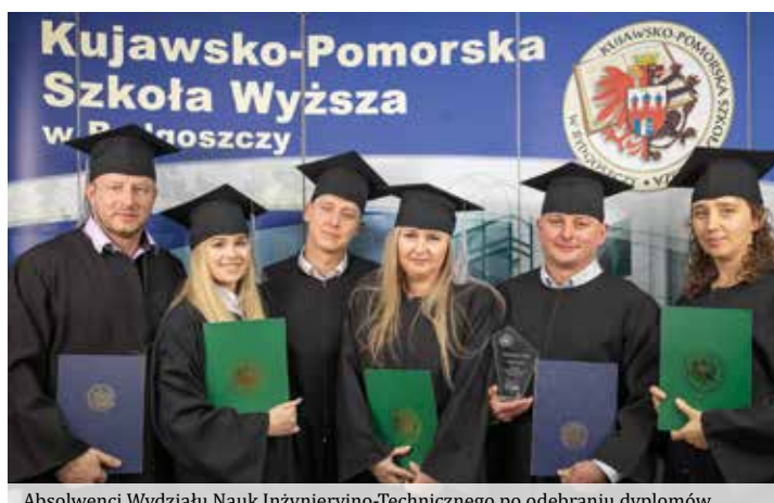
Absolwenci Wydziału Nauk Inżyniersko-Technicznego po odebraniu dyplomów