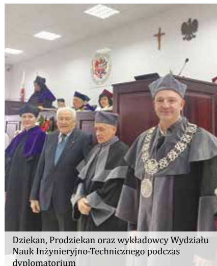
Dziekan, Prodziekan oraz wykładowcy Wydziału Nauk Inżynieryjno-Technicznego podczas dyplomatorium